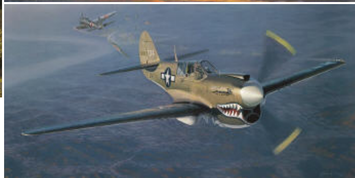
Into the Teeth of the Tiger