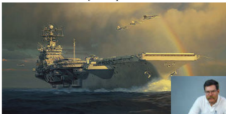
Lightning from the Sun